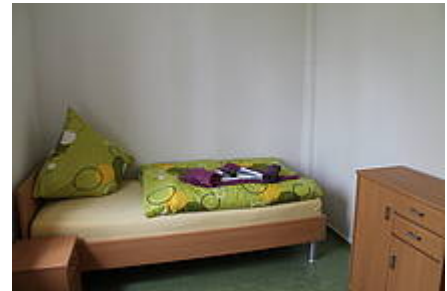
Abb. 7: Apartment 2