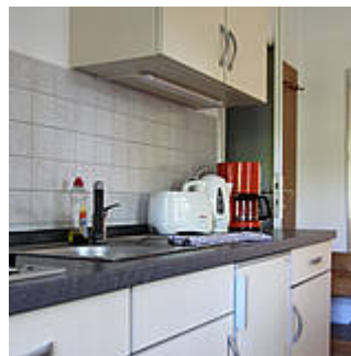
Abb. 3: Küche