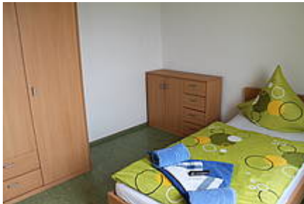
Abb. 6: Apartment 1