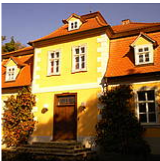
Abb. 1: Außenansicht

Das „Haus Heise“ verfügt über neun möblierte Apartments, bestehend aus einem kombinierten Wohn- und Schlafbereich, einer vollständig eingerichteten Küche sowie Bad mit Dusche.