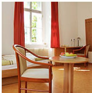
Abb. 2: Apartment