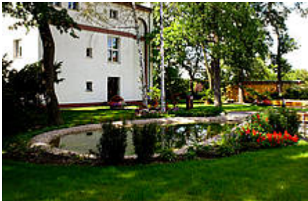
Abb. 5: Außenansicht

Das „Weiße Haus“ bietet den Mietern 10 möblierte Zimmer mit Blick auf die Peißnitz.